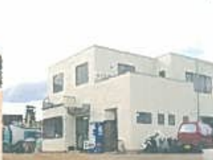
本社事業所(管理棟) 60tonデジタル計量システム