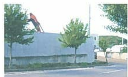
高3m x 長60mコンクリート製飛散防止壁