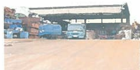
施設正面&メインタワー 4.9tonリフマグ天井クレーン